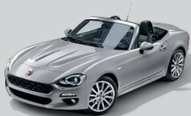
5CD SZARY ARGENTO - METALIZOWANY