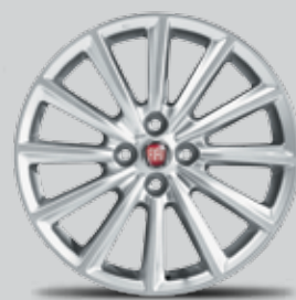
FELGI ALUMINIOWE 17"