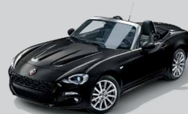
5DN CZARNY VESUVIO - METALIZOWANY