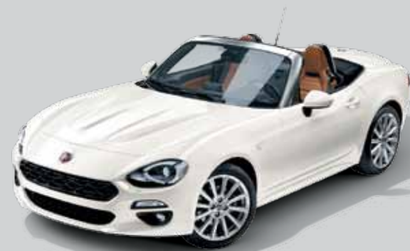
124 SPIDER LUSO

PAKIET BOSE® z systemem audio Bose® z 9 głośnikami, z których 4 wbudowane są w zagłówki, z automatyczną regulacją poziomu głośności w zależności od położenia składanego dachu.