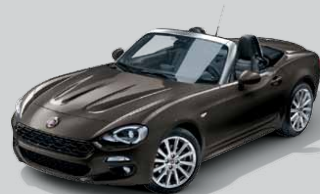
210 BRĄZOWY MAGNETICO - METALIZOWANY