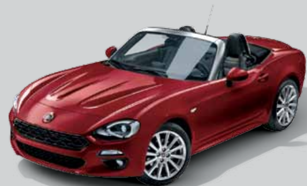
5CA CZERWONY PASSIONE - PASTELOWY