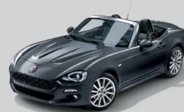
5CE SZARY MODA - METALIZOWANY