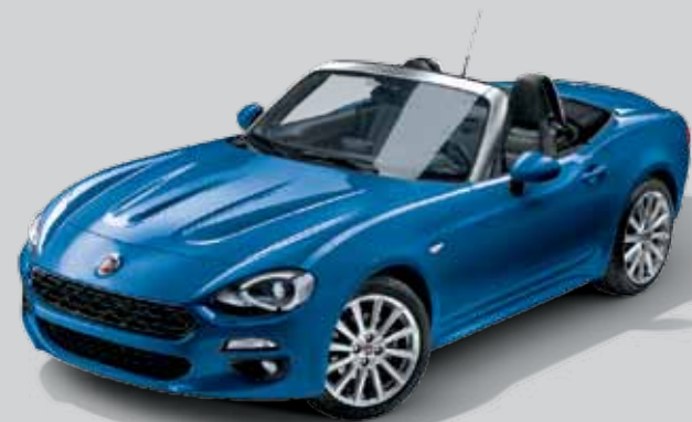
5CC NIEBIESKI ITALIA - METALIZOWANY