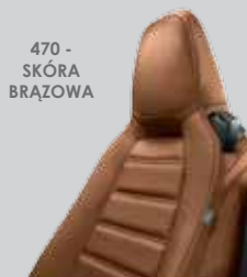
470 - SKÓRA BRAZOWA