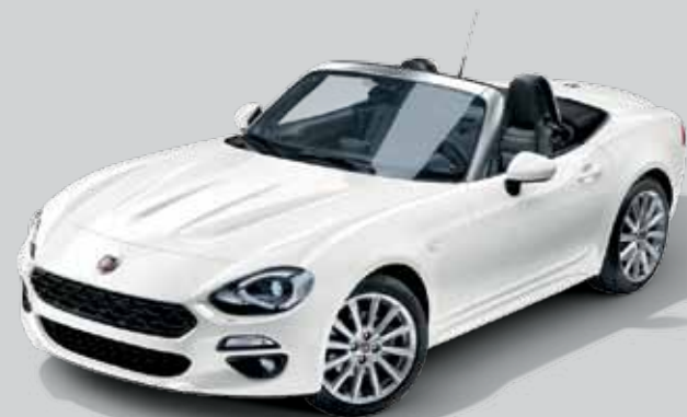
5CB BIAŁY GELATO - PASTELOWY