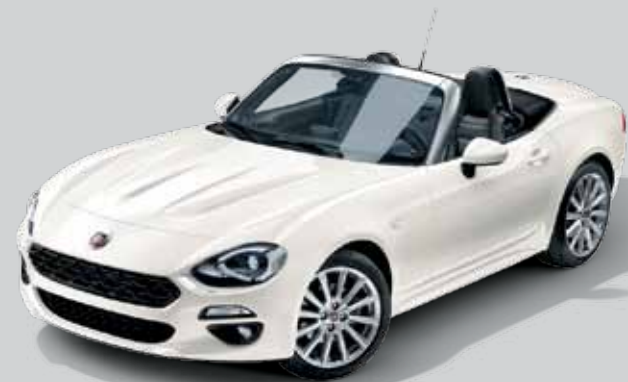
802 BIAŁY GHIACCIO - PERŁOWY