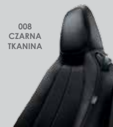
008 CZARNA TKANINA