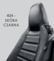
404 - SKÓRA CZARNA