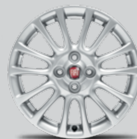
FELGI ALUMINIOWE 16"