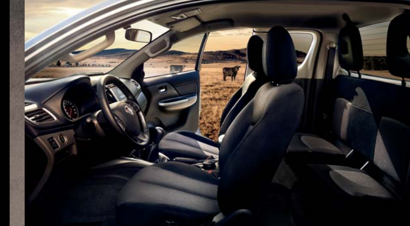
PRZEDŁUŻONA KABINA Z MATERIAŁOWĄ TAPICERKĄ SIEDZEN.