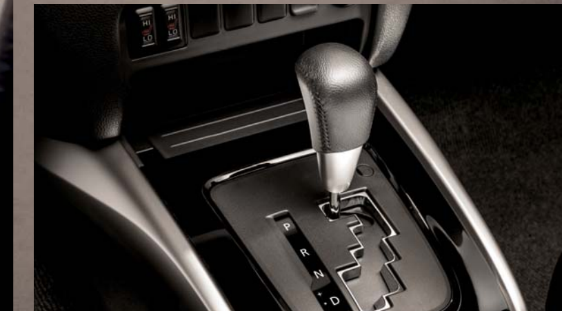
AUTOMATYCZNA SKRZYŃNIA BIEGÓW.