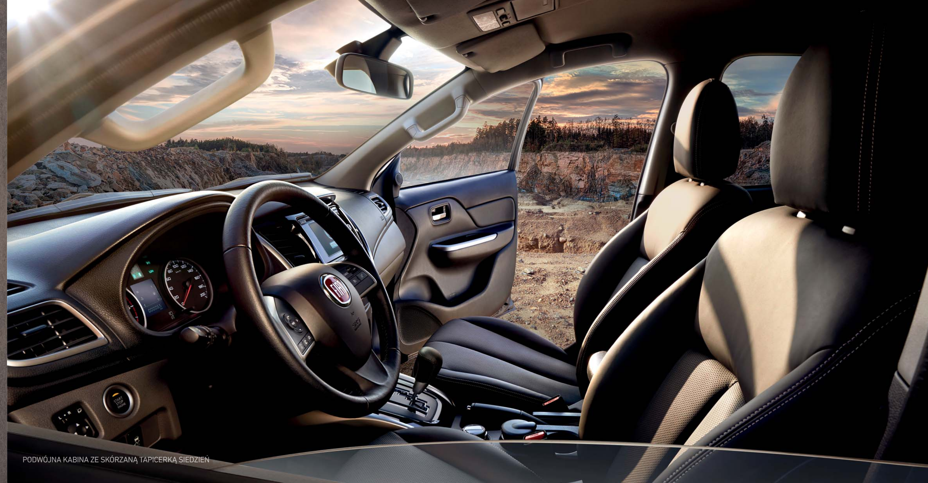
PODWÓJNA KABINA ZE SKÓRZANĄ TAPICERKĄ SIEDZIEN

Urządzenia multimedialne, takie jak RADIO PLUS NAWIGACJA Z EKRANEM DOTYKOWYM , systemem BLUETOOTH® oraz KAMERĄ WIDOKU WSTECZNEGO , w które wyposażony jest Fullback umożliwiają pozostawanie w stałym kontakcie z otoczeniem.