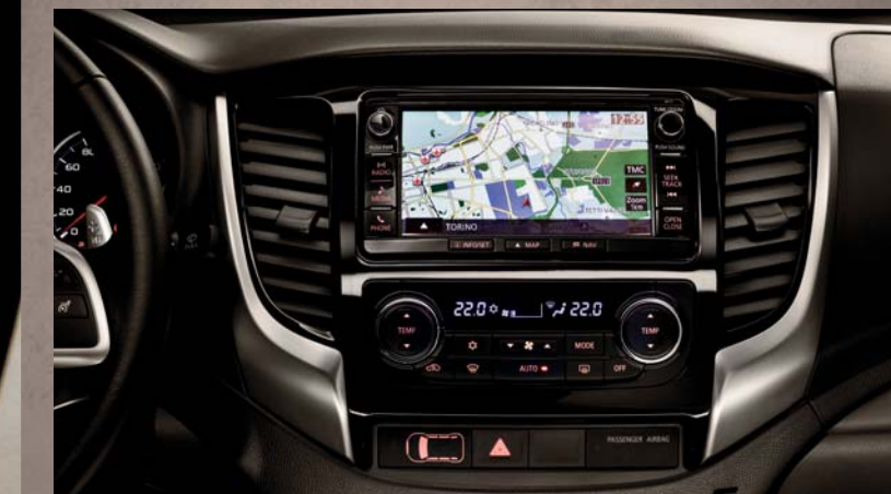
RADIO ORAZ NAWIGACJA Z EKRANEM DOTYKOWYM.