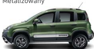
374 Zielony Toscana Metalizowany