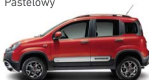
289 Czerwony Passione Pastelowy