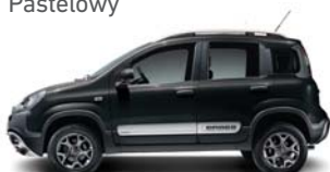
601 Czarny Cinema Pastelowy