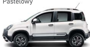
296 Biały Gelato Pastelowy