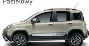
715 Beżowy Cappuccino Pastelowy